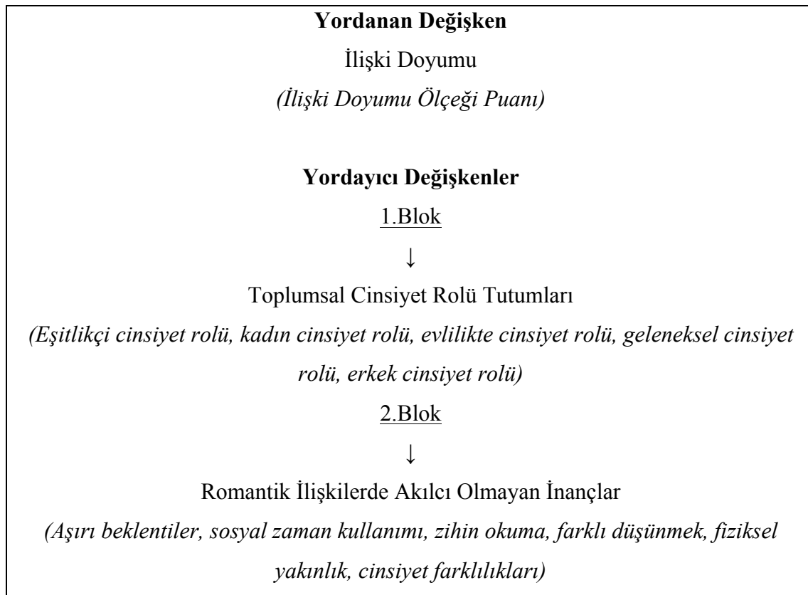
Tablo 3.2.2. İlişki Doyumunu Yordayan Değişkenlere İlişkin Hiyerarşik Regresyon Analizi Aşamaları

Bu aşamada ilişki doyumunu yordayan değişkenleri belirlemek amacıyla hiyerarşik regresyon analizi yapılmıştır. Bu amaçla, sırasıyla Toplumsal Cinsiyet Roller Tutum Ölçeği'nin alt boyutları olan eşitlikçi cinsiyet rolü, kadın cinsiyet rolü, evlilikte cinsiyet rolü, geleneksel cinsiyet rolü ve erkek cinsiyet rolü ile Romantik İlişkilerde Akılcı Olmayan İnançlar Ölçeği'nin alt boyutları olan aşırı beklentiler, sosyal zaman kullanımı, zihin okuma, farklı düşünmek, fiziksel yakınlık ve cinsiyet farklılıkları yordayıcı değişkenler olarak analize alınmıştır. Hiyerarşik regresyon analizinin aşamaları Tablo 3.2.2.'de verilmiştir.